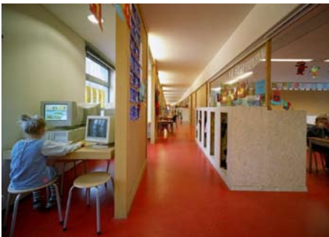
voorbeeld schoolgebouw Marlies Rohmer